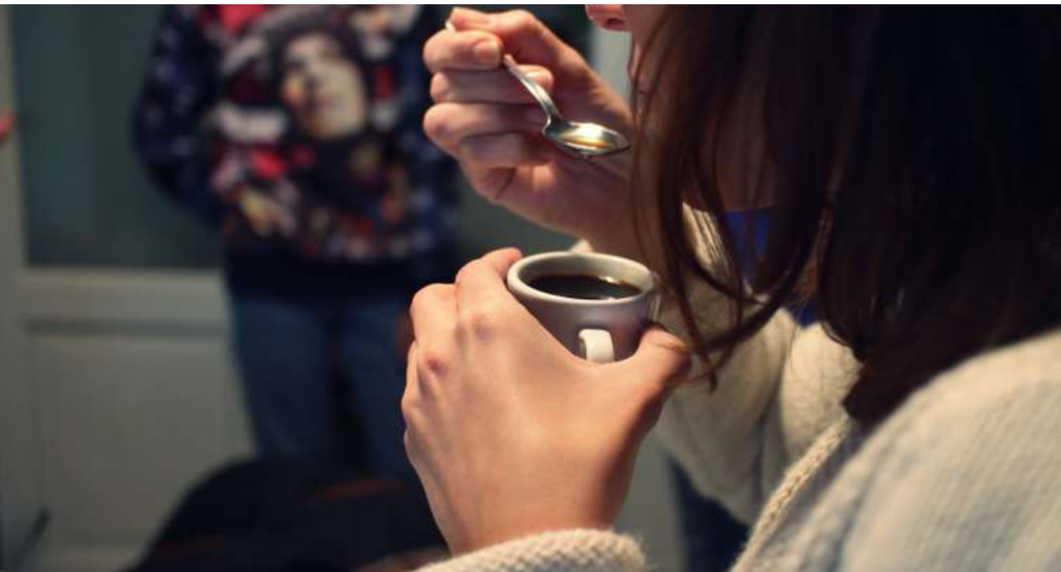
Nella foto pausa in cucina